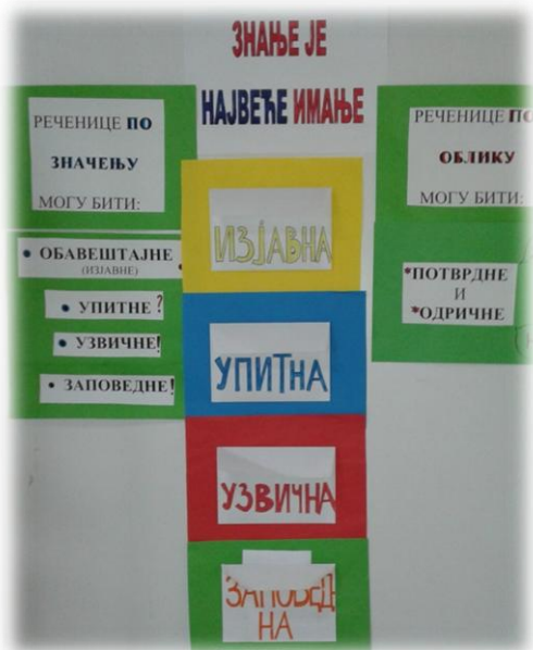
Пано у учионици

Такође одређујемо каква је према значењу и облику прочитана реченица.