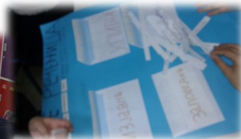
Уписивање знака и разврставање реченица по значењу